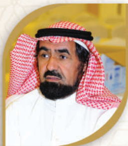
الشيخ / أحمد بن محمد الغماس الأمين العام